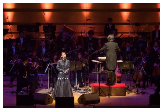
billboard classics Premium Symphonic Concert in Nagano