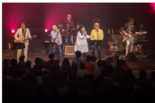
SKYE&FRIENDS～僕たちとシティ・ポップ～