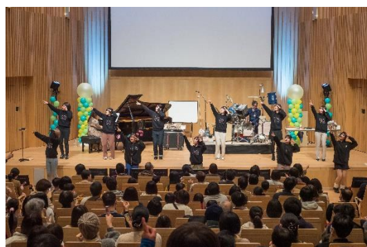
ファミリーコンサート 音と遊ぼう！