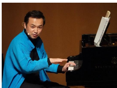
加藤昌則の超ぶっとび！クラシック 2