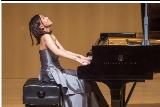
水曜ひるまのクラシック・リサイタルシリーズ