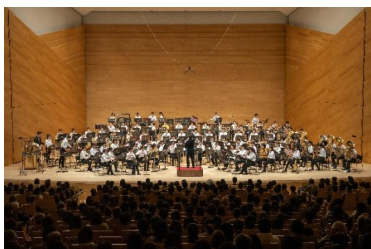
スーパー・ウインド・オーケストラ with NAGANO12

大きなキャンパスに色紙を重ねて貼ることで、作品を制作しました。(参加者 20 名)