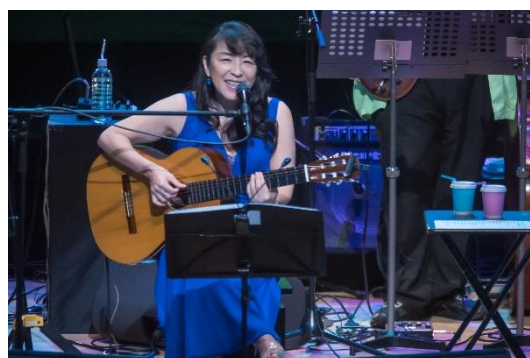
小野リサ ボサノヴァ・ナイト