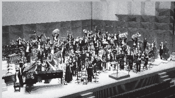
シエナ・ウインド・オーケストラ Siena Wind Orchestra

執筆でも知られ、「オーケストラ楽器別人間学(新潮文庫)」など多数の著書がある。最新刊はドイツ語単語からの連想エッセイ「アイネクライネなわが回想」(幻戯書房)