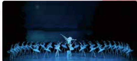
Illustration: Satoru Makimura