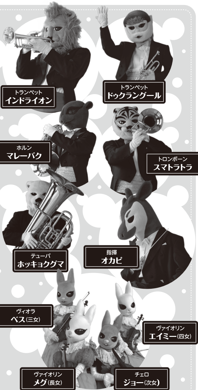
トランペット インドライオン