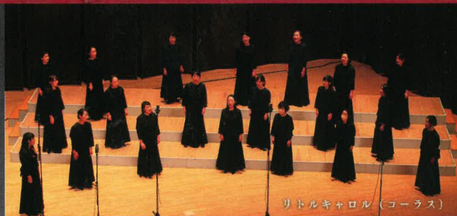
リトルキャロル (コーラス)