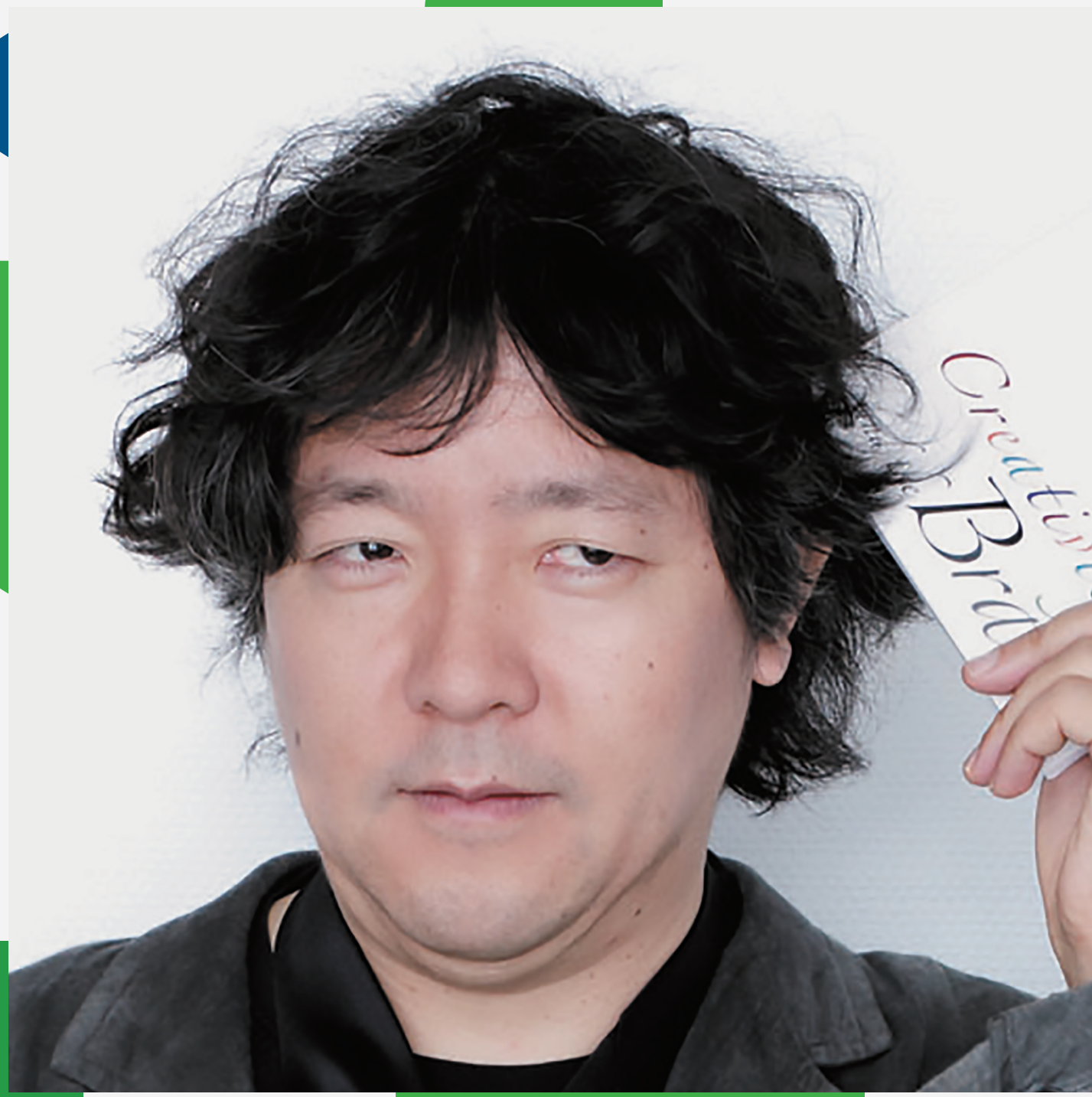
脳科学者 茂木健一郎