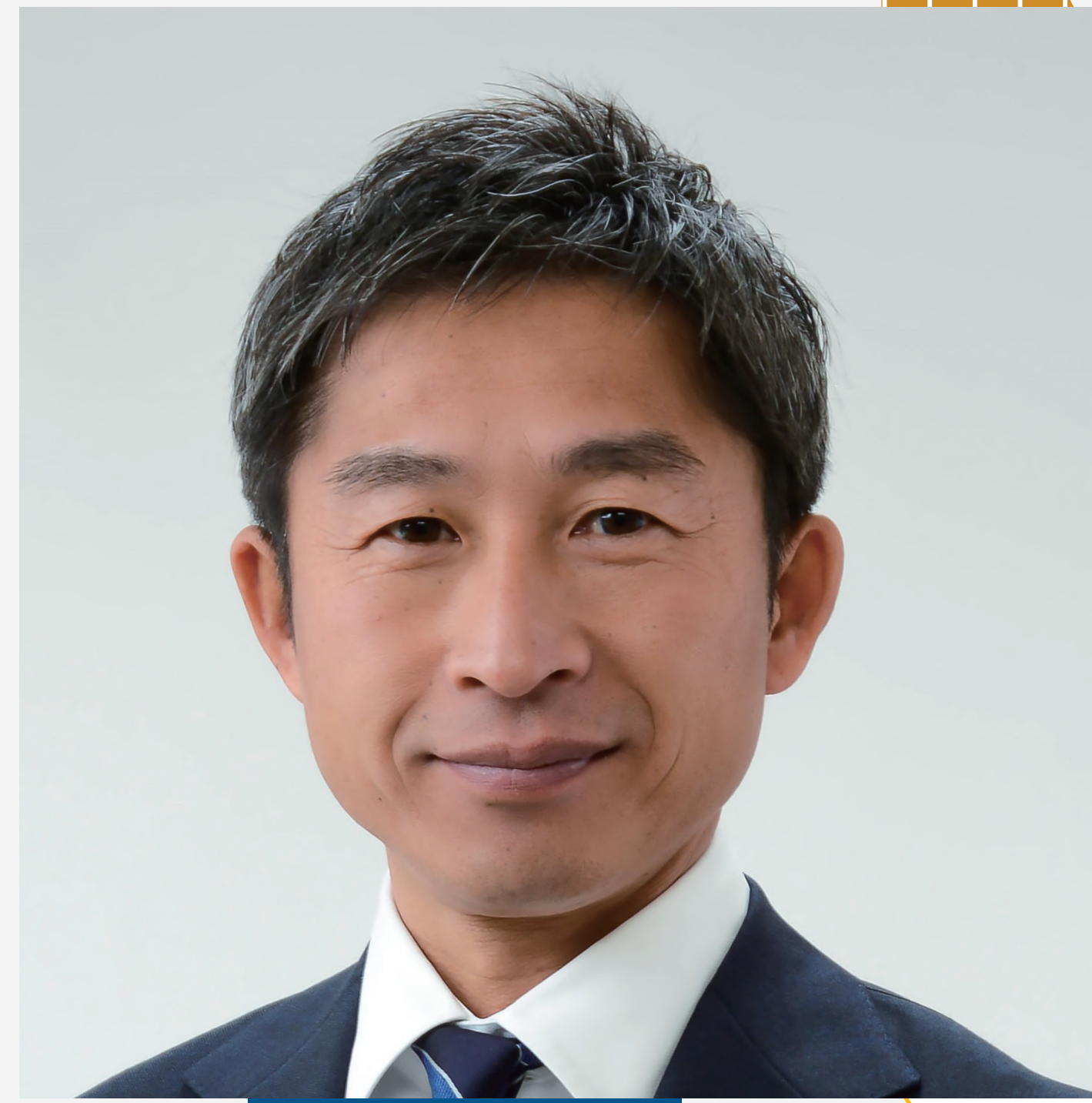
長野市長 荻原健司

長野市は2021年5月に「SDGs未来都市」に選定され、持続可能な地域づくりを目指しています。 長野市SDGsフォーラムでは、ゲストとともに長野市長と長野に住む若者が「長野のSDGs」を見つめなおします。