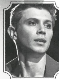
エフゲニー・ ペトレンコ

ご注意とお願い チケットをお求めの際は、予め下記の事項をご了承くださいますようお願い致します。