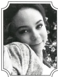
マリア・ シュピロワ