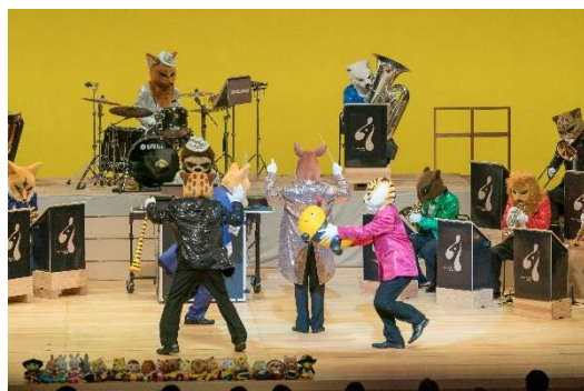
冗談音楽の祭典「ズーラシアンプラス・ショー」