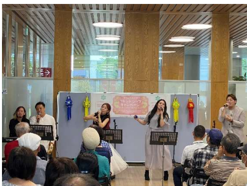
ロビーコンサート (タイ王国プロモーション事業)

また、お届け芸術館では、「岩野商会」「西之門よしのや」といった市内企業や「長野県立美術館」「松代文武学校 剣術所」などの観光地で演奏等を行い、街に音楽や伝統芸能を通じた賑わいを提供しました。