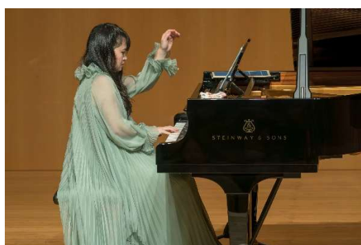
水曜ひるまのクラシック・リサイタルシリーズ