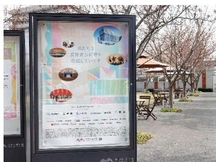
ポスター（令和6年度）