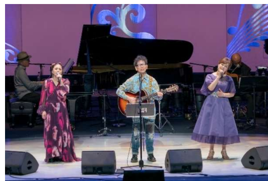
復興 NAGANO！音楽祭 2024 ～絆～