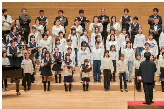
東京混声合唱団～長野市のこどもコーラスとともに