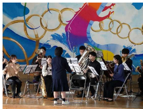
NAGANO 1 2 訪問コンサート （三陽中学校）