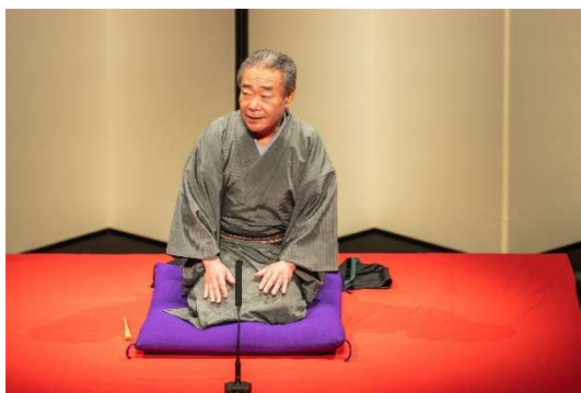
長野市芸術館 落語祭（其の壺、其の式）