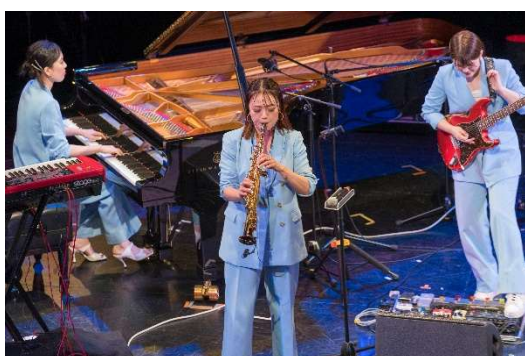
ジャズ・フェスティバル 2024