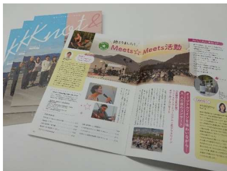
音楽とまちを楽しむ情報誌 「Knot& (ノットアンド)」NO.1

長野市芸術館のゼロから公演を企画制作するノウハウを活かし、地域でのイベント開催に協力しました。長野県立美術館から依頼を受けて長野市芸術館が、イベントの趣旨、会場の作り方、アーティストの選定などをプロデュースし、来場者400人規模の公演を行うことができました。