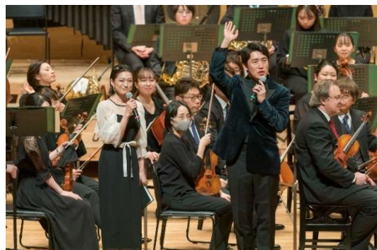
オーケストラってなあに？ 東京交響楽団とともに贈るオーケストラ入門コンサート