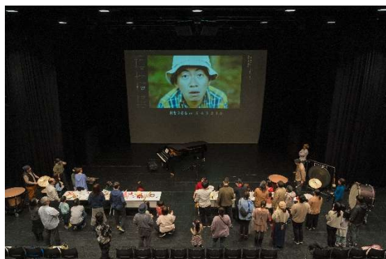
市民企画公演 vol.2 SOUND WITH MOTION 映像に合わせて音を楽しもう

市民の文化芸術活動支援の一環として、芸術館の練習室等の利用者がその練習成果をステージで発表する場を提供しました。(出演 19 団体、来場者 389 人)