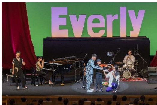
Everly クリスマス・コンサート 2024