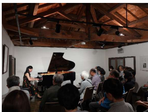
お届け芸術館 （信州大学教育学部 赤煉瓦館）