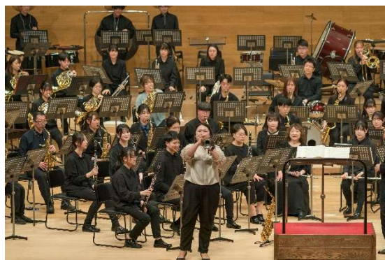
須川展也プロデュース 長野市芸術館プラス・フェスティバル Vol.6 スーパー・ウインド・オーケストラ with NAGANO 1 2