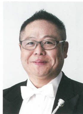
高橋 敦 Osamu Takahashi

富山県生まれ。洗足学園音楽大学を経て、洗足学園音楽大学を卒業。トランペットを津堅直弘、関山幸弘、佛坂咲生氏の各氏に師事。第65回日本音楽コンクール第1位。第13回日本管打楽器コンクール第1位。新星日本交響楽団(現・東京フィルハーモニー交響楽団)を経て1999年、東京都交響楽団首席奏者に就任。宮崎国際音楽祭、霧島国際音楽祭、セイジ・オザワ松本フェスティバル、防府音楽祭、三島せせらぎ音楽祭などへ定期的に参加。2016年に開催されたGolden Brass Japan Festival at Port of Moji 音楽監督。これまでにソリストとして国内外のオーケストラや吹奏楽団と共演。世界で最も権威と伝統があるミュンヘンARD国際音楽コンクールの審査員も務める。洗足学園音楽大学客員教授、東京音楽大学講師。