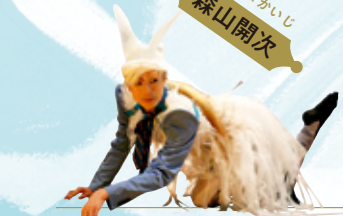
もりやまかいじ 森山開次