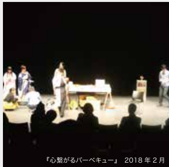
『心臓がるパーベキュー』 2018年2月