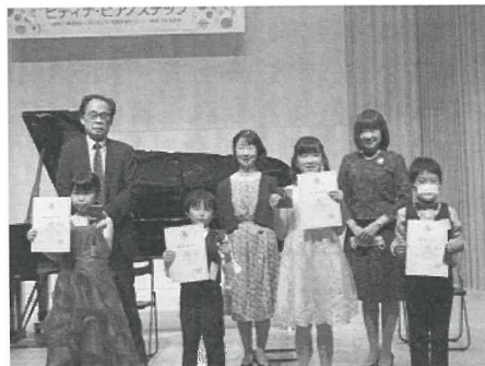
(写真) 過去の長野秋季地区より