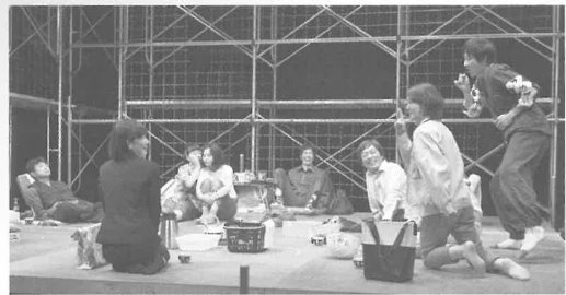
2017年6月 吉祥寺シアター公演より

舞台美術：杉山 至 装置：濱崎賢二 照明：西本 彩 衣裳：正金 彩 舞台監督：小林朝紀 宣伝美術：工藤規雄+渡辺佳奈子 太田裕子 宣伝写真：佐藤孝仁 ロケーション・コーディネーター：渡辺一幸 (NEGO-TI) 制作：石川景子 金澤 明 撮影協力：(株)TYOテクニカルランチ 恵積興業(株) 協力：(株)アレス 企画制作：青年団/(有)アゴラ企画・こまばアゴラ劇場 主催：一般財団法人長野市文化芸術振興財団