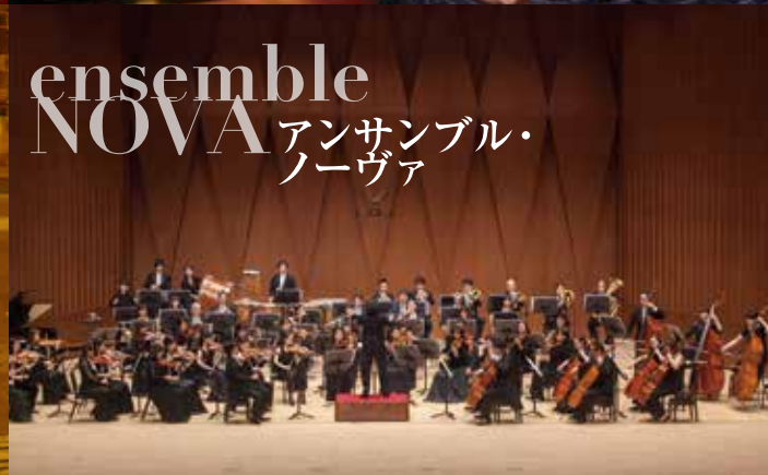
ensemble NOVA アンサンブル・ノーヴァ