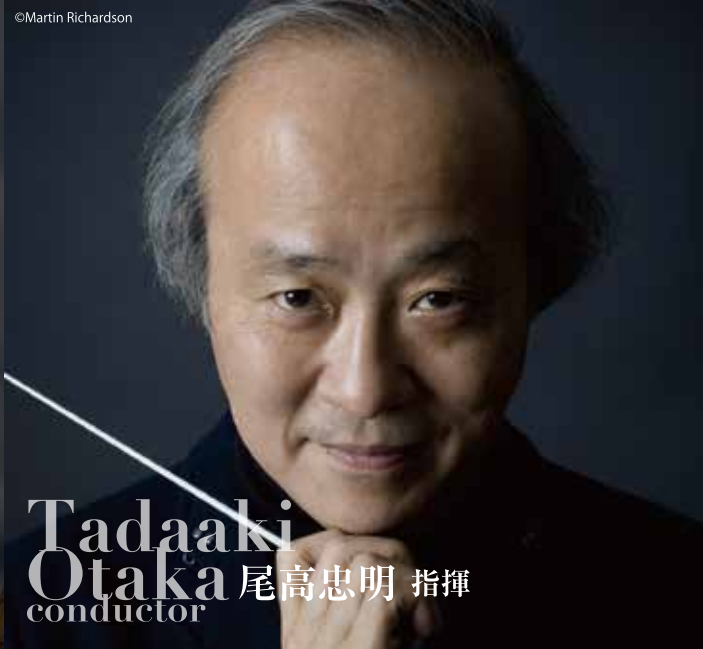
Tadaaki Otaka 尾高忠明 指揮 conductor