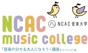
「音楽の分かる大人になろう！講座」のイラスト