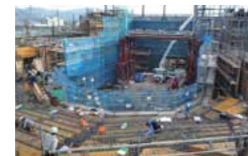
昨年12月に大ホール客席2階部分の段床から、舞台側を眺めた状況です。今ではこの上に屋根もかかり、完成に近づいてきました。

このインタビューの間にも、工事は進行中です。建設の状況は、事務局のウェブサイトにて更新されています。普段見ることのできない内部の様子なども掲載。ぜひご覧になってみてください。